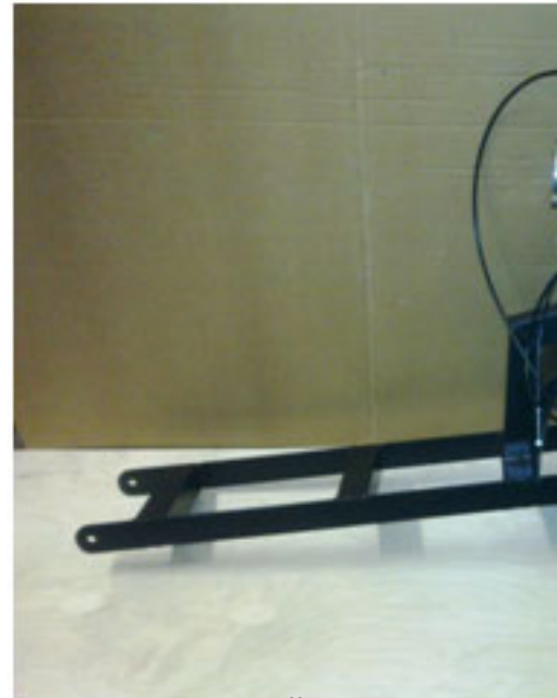
Проектное решение конструкции и сборки двигателя и привода с приводом от двигателя «ST-4.0»